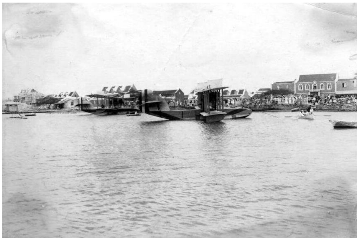
Avion Mericano dilanti di Coomandeursgebouw (Gezaghebberskantoor) dilanti di Havenstraat 1924 - Aruba

“Pasando door di e corantnan Arubiano, mi a weita den Awe Mainta di dia 21 di Maart 2016, un articulo tocante di Paardenbaai y e trabounan di draga eyden (aña mas o menos 1930) riba pagina 28. Den e articulo tin un bunita foto di Paardenbaai su costa y edificionan. Compara e foto aki cu e otronan.” Nicky.